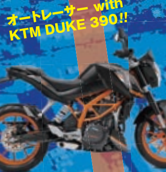
オートレーサー with KTM DUKE 390!!

(浜松オート) オートレース:通算1回優勝 ロードレース:元JSB1000日本チャンピオン