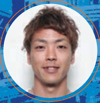
あおやま しゅうへい

(川口オート) オートレース:通算12回優勝(G12回含む) ロードレース:元WGP125cc2年連続世界チャンピオン