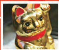
また御利益がないという招き猫