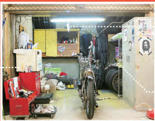
突撃取材したにもかかわらず、キレイに整頓されていたのが印象的でした。