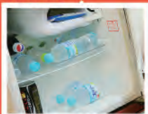
冷蔵庫まである快適空間!