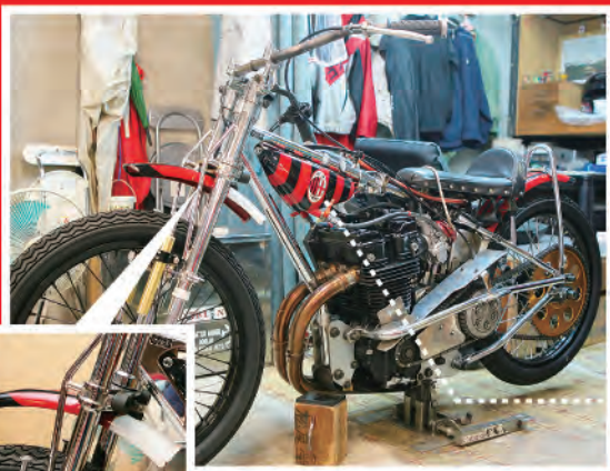
フェンダーの白はミランユニフォームのパンツをイメージ