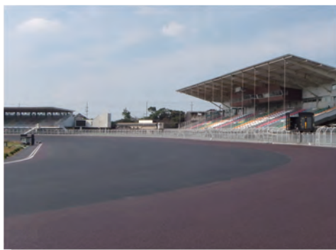
⑤ 10月中旬、最上層である競走路専用アスファルトを舗装し、バンク傾斜を確認しました。