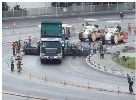
④ 9月下旬、「フェーゲル」という特殊なドイツ製舗装機械を使用し、中間層となるアスファルトを敷きならしました。