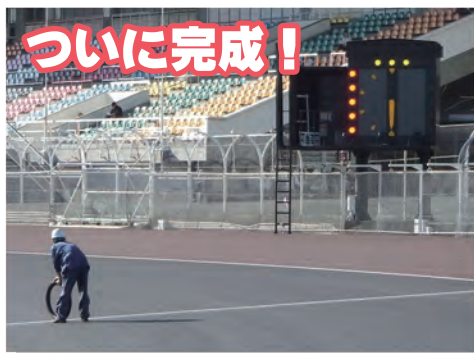
⑧ 11月1日、大時計を移動させ、各ハンデ位置にタイヤを乗せてフライング・センサーのテストを実施しました。