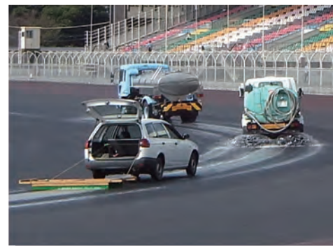
⑥ 10月下旬、競走路の表面に浮いてくる油膜を、日数をかけて念入りに除去清掃。スリップを減らし接地感を高めます。