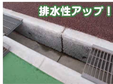
⑨ 競走路に浸透した雨水が、側溝へとスムーズに流れ出るしくみになっており、これまでにない速乾性を実現しました。