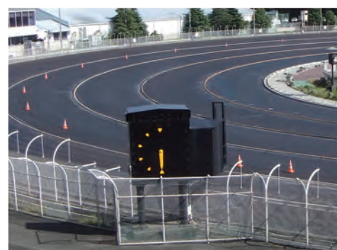
③ 9月上旬、ロードローラーで整地した最下層の表面に漆黒の接着剤を塗布し、舗装の強度を高めました。