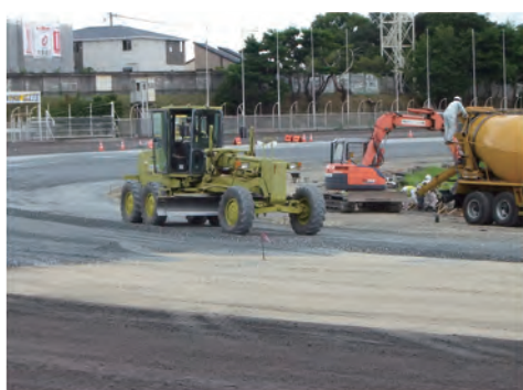
② わずか数日で走路下の白い土壌が顔を出しました。整地後、水はけを良くする最下層（砂利の層）を形成しました。