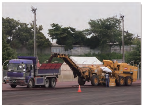
① 2011年8月15日工事開始。 22年間、名勝負が繰り広げられてきた競走路を重機で掘削しました。

このたびは22年ぶりの競走路改修ということで、平坦性・透水性・すべり抵抗性を特に留意し、計画から工事完了までスタッフ全員で力を合わせ、高品質のものをつくりあげることが出来ました。雨天時にも大量の雨水を速やかに排水できる仕組みになっています。