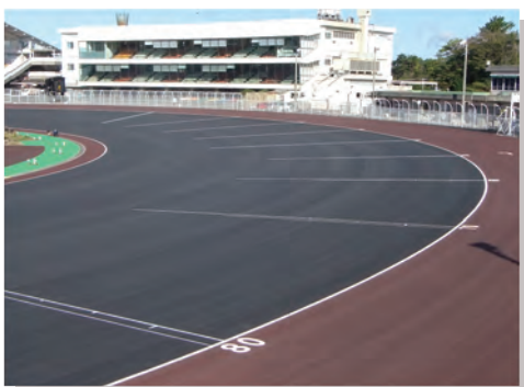
⑦ 10月31日、スタート線、ゴール線、内外線が書き込まれ、本格的な競走路らしくなりました。